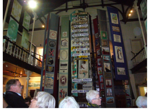
Museet i Metodistkirken i District 6

folk fra Indonesien og mon ikke man også kunne have fundet nogle enkelte europæere. Der var en håndfuld af religioner repræsenteret, protestanter (blandt dem Moravians), katoliker,