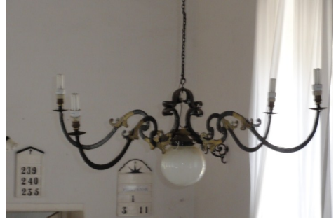
Lysekroner i kirken i Mamre

Og som et kuriosum har de et par lysekroner, der ligner vores. Man skulle tro at de stammer fra samme værksted i Tyskland.