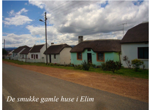
De smukke gamle huse i Elim

Fra kirkebakken er der udsigt ned over en lang gade, hvor menighedshusene ligger side om side, omtrent så langt som øjet rækker. Her bor næsten alle menighedens medlemmer: Der bor i hvertfald ingen, der ikke er medlem. Det er en ældsterådsbeslutning.