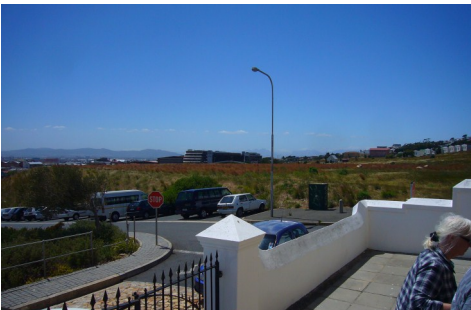
Udsigten fra Moravian Chapel

En gang om året holdes en gudstjeneste for folk der har boet i District 6 og deres børn. Resten af året er kirken tom. Når man står udenfor Moravian Chapel og ser sig omkring, har man en udsigt til hvad man kunne kalde Nemesis, for hele landskabet ligger hen som et overdrev, der er helt tilgroet. Her ville ingen bo. For at dække over fiaskoen byggede regeringen et par store nydelige bygninger, der huser nogle fakulteter under Cape Towns universitet.