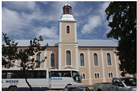
Kirken i Gnadenthal