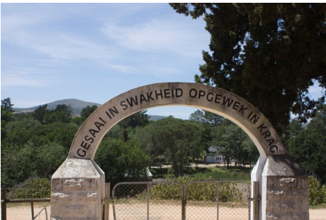
Portalen til Gudsageren i Mamre

Dens indre var også som vi kender det, der er prædikebord, der ligesom i Christiansfeld står på et podium så Guds ord kommer oppefra. Der er hvide bænke som vores. Selv måden de er sat sammen på, og for eksempel de små nedklappelige hylder på stoleryggen til nadverbægeret, ja de var lavet lige sådan som dem i vores kirkesal. Ingen af stederne brugtes sand på gulvet.