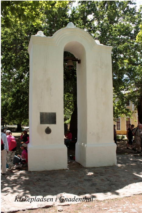
Kirkepladsen i Gnadenthal

Men, så kommer forskellen: Man finder ikke et brødrehus, ikke et søsterhus og ingen enkehus. Mangelen på disse korbuse hører rimeligvis sammen den kulturforskel der er mellem afrikanerne og os. De har et familiemønster hvor man bor hjemme til man bliver gift. Og når man bliver gammel bor man hos et familiemedlem. I det gamle Christiansfeldt var det jo almindeligt at kun en lille del af menigheden blev gift. De ugifte boede så i brødrehus eller søsterhus. Og siden man i Syd Afrika ikke kendte til småfabrikker og brødre, der tog til andre byer for at dygtiggøre sig i deres håndværk, var brødrehuset en nødvendig ting.