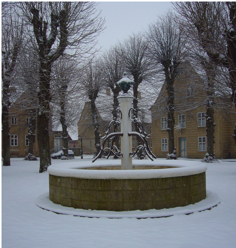
Kirkepladsen december 2010