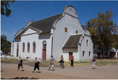
Kirken i Mamre

Det er byen Mamre. Den blev grundlagt i 1808. Kirken er en stor hvidmalt bygning ud mod hvad der en gang var landevejen.