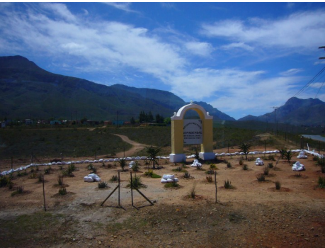
Velkommen til Gnadenthal

Rejsen foregik i slutningen af oktober og lidt ind i november, netop på den tid, hvor foråret indfandt sig i det sydlige Afrika. Det gav lejlighed til at se dette smukke land på den smukkeste tid. Landskaberne kunne sagtens være emnet for sådan en tur, men det var det bare ikke. I stedet rejste vi primært for at se de steder, hvor brødremenigheden først etablerede missionsstationer og dannede nye menigheder. Her som andre steder hvor brødrene slog sig ned, henvendte de sig først og fremmest til de fattige indfødte, og dette er måske grunden til nogle af de forskelle man finder ved en sammenligning med menighedsbyer i Europa. Den første missionsstation blev startet i 1738 af tyskeren Georg Schmidt. Han ændrede stedets navn fra Bavianskloof til Gnadenthal, der klinger bedre i en tysk brødremissionærs øren.