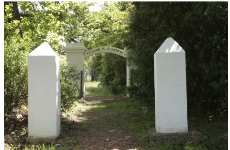
Gudsageren i Gnadenthal

ude i byen og der er da også kun få huse med boliger for menighedsmedlemmer nede ved kirken. Men byen rummede et præsteseminarium og der er også en præstebolig. Efter besøget blev vi beværtet i en lille sal (større end "Lille Kirkesal" en mindre end en korsal). Sådant en opvartning var der ved alle besøg i menighederne.