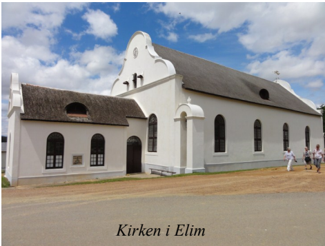
Kirken i Elim

Det næste besøg var i Elim langt mod syd. Denne by ser ganske anderledes ud. Kirken (der udefra heller ikke ligner vores) ligger på et højedrag. Bag