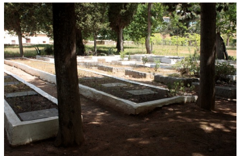
De gamle missionærgrave