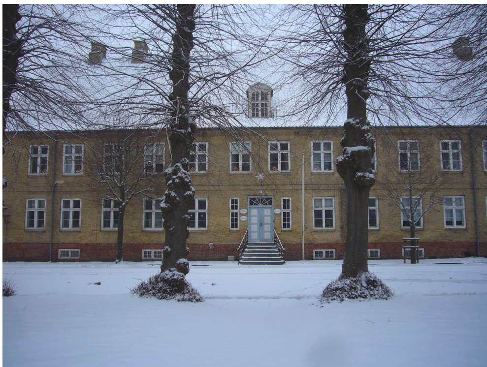
Søstrehuset en kold vinterdag