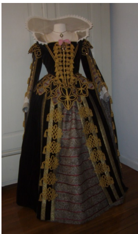
En flot kjole syet hos H I S T O R I C U M

Kolding Kommune gennemfører, parallelt og efterfølgende en større indsats med investeringer i fornyelse og opgradering af gader, pladser og udendørsarealer i den historiske bykerne i perioden 2010-2023.