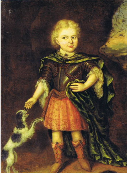
Zinzendorf som ca. treårig med sin lille hund i fineste herskerskrud .

I 1715 deltog Zinzendorf for første gang i nadveren. Det gjorde et stærkt indtryk på ham. Ifølge Zinzendorf skrev han det berømte digt: „ So ist es dann geschehen, ich habe Gott gesehen. Er hat sich eingefunden, und sich mit mir verbunden. “ I 1722 skriver han i et brev til Francke, at han efter at havde deltaget de første gange i nadveren, bliver grebet om hjertet af Gud. Han kunne nu se, hvilken tåbelig indbildning han havde om sig selv, og han kom til at tænke på alt det, han havde gjort forkert. Han lovede sig selv, at han med Guds hjælp ville blive et andet og bedre menneske. ” Fra den tid af har Guds trofasthed gravet bestandig dybere og lagt en stadig bedre