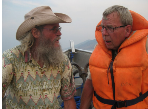
Lidt betænkelige miner i en båd, der gynger.