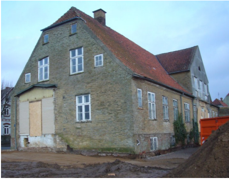
Lindegade 2 mod syd og -vest