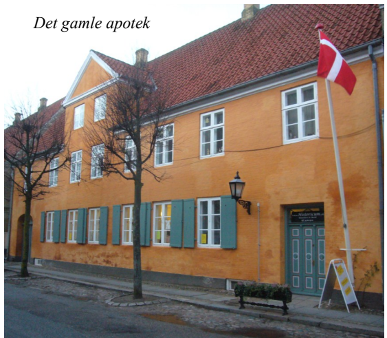
Det gamle apotek