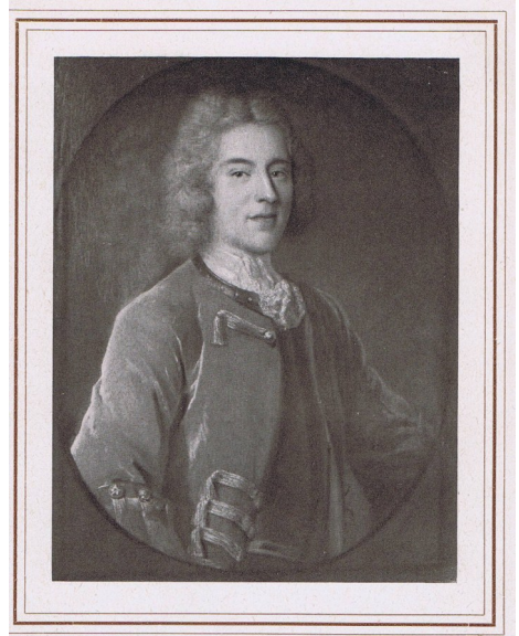
Zinzendorf som 20 årig ung mand. Billedet stammer fra et oliemaleri fra 1720

Zinzendorfs dagbog indeholder mange udtryk for hans strenge pietistiske livssyn: ” I dag har jeg leet rigelig meget og sammen med disse herrer gjort mig lystig over andre, hvilken stor forseelse Gud må tilgive mig! ” ” Jeg tilbragte resten af dagen med at sørge over kristenhedens forfald, at man på sabbatten ikke tjener Gud, men Satan, med frådseri og svir og usømmelige taler. ” Han satte sig for, at han ville bede mindst 12 gange om dagen for at blive i stadig forbindelse med Gud. Om søndagen fastede han og modtog ikke besøg for at kunne bruge dagen til bøn.