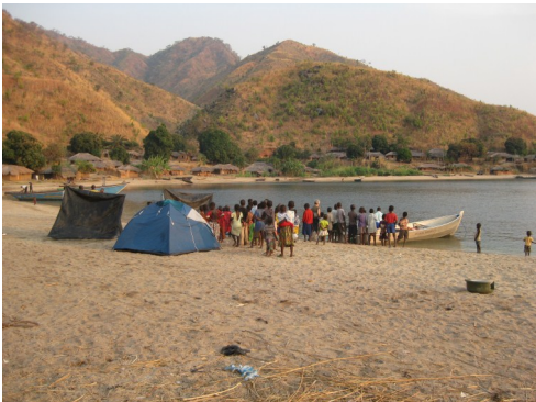
Overnatning i telte på stranden