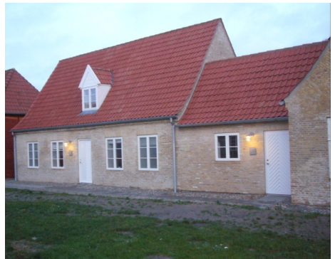
Lindegade 27 Hotel annekset