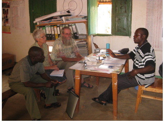
Møde på en lokal sundhedsklinik