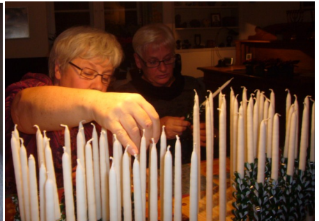
Så klippes der lys til juleaften