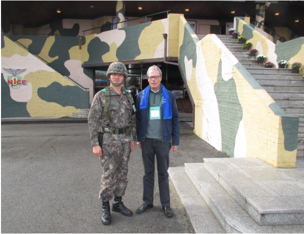
Brødremenighedens præst sammen med sydkoreansk grænsevagt på grænsen mod Nordkorea

Korea og få syn for sagen. Det gjorde stort indtryk at høre historien fra nogle af de soldater, der holder vagt ved grænsen. Meget indtryksfuldt var også musicals og skuespil, der fortalte Koreas historie. Desuden gjorde det et uudsletteligt indtryk at besøge en koreansk mega-kirke.