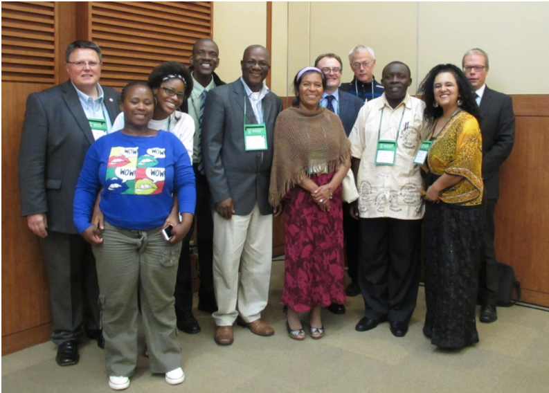
Brødrekirkerepræsentanter på Kirkernes Verdensråds Generalforsamling, Busan 2013

Generalforsamlingen er Kirkernes Verdensråds højeste myndighed. Den mødes hvert syvende år for at evaluere de foregående års arbejde og udstikke retningslinier for den kommende periodes virksomhed. Alle medlemskirker inviteres til at sende repræsentanter, også kaldet delegater, til generalforsamlingen, hvor central- og eksekutivkomiteen vælges. Her vælges også KVs otte præsidenter. Jeg var selv med som delegeret repræsentant, repræsenterende den Verdensomspændende Brødrekirke.