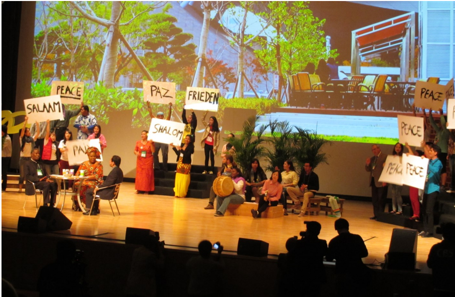
En af de mange præsentationer ved konferencen