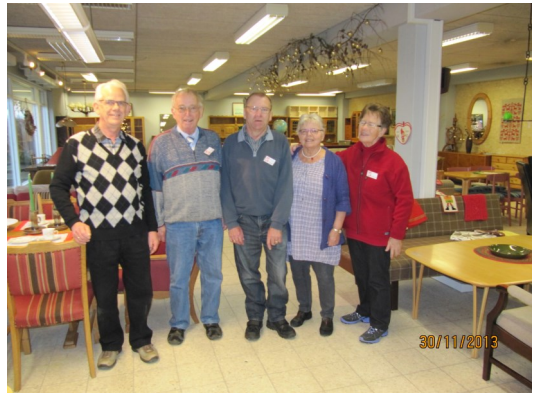
Fem af sliderne