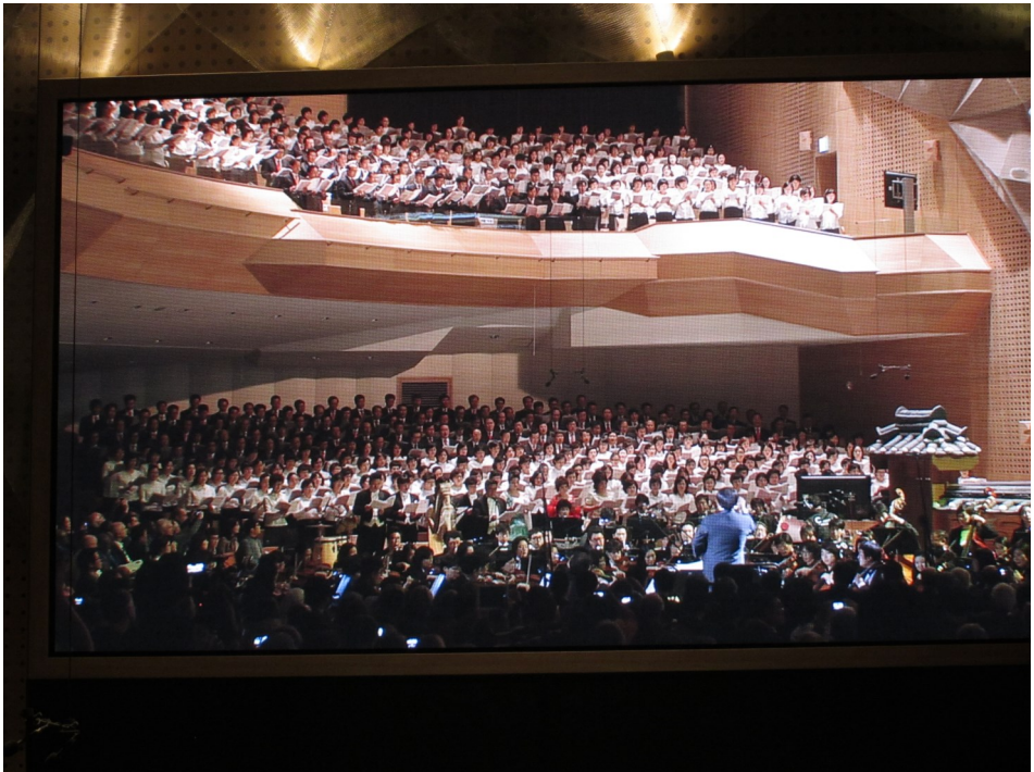
Koreansk megakirke med 800 mand (og kvinde) stort kirkekor

3. Vi deler vores erfaring om, at det, at man arbejder på genforening i Korea, er et tegn på håb for verden. Det er ikke det eneste land, hvor mennesker lever opdelt, i fattigdom og rigdom, glæde og vold, velfærd og krig. Vi må ikke lukke vore øjne for hårde realiteter og vi må ikke holde op med at arbejde for Guds forvandlende arbejde. Som et fællesskab står Kirkernes Verdensråd solidarisk med folkene og kirkerne på den koreanske halvø, og med alle, som stræber efter retfærdighed og fred.