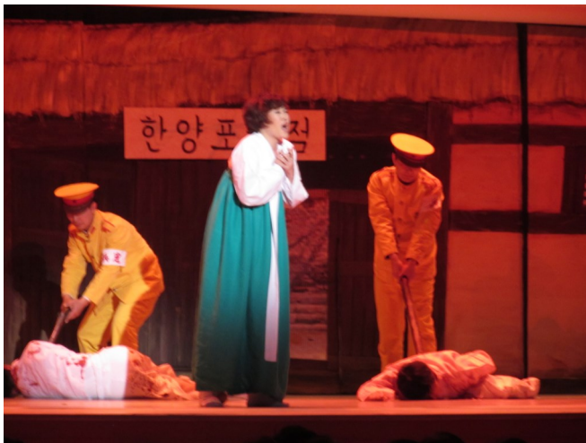
Koreas folk har gennemgået ufattelige lidelser. Dette blev fortalt gennem en musical

Generalforsamlingen, den tiende siden KV's grundlæggelse i 1948, havde som motto: "Livets Gud, led os til retfærdighed og fred." Dette tema blev på mange forskellige måder gennemspillet i den 10 dage lange generalforsamling. Ca.