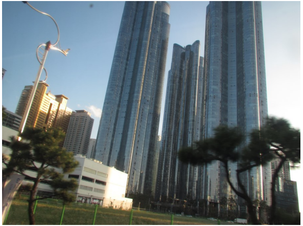
Busan, moderne koransk storby med omkring 3 millioner indbyggere

politiske og åndelige udfordringer konfronterer os. I mørket og dødens skygge, i lidelse og forfølgelse, hvor værdifuld er da ikke håbets gave fra vor Opstandne Frelser! Ved Helligåndens flamme i vore hjerter, beder vi til Kristus om at oplyse verden: for at hans lys må bringe hele vores eksistens til at tage vare på hele skabningen og at bekræfte at alle mennesker er skabt i Guds billede. Idet vi lytter til stemmerne, der ofte kommer fra