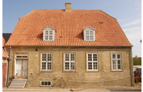
Lindegade 26 efter

Ud over at taget naturligvis er omlagt, er der ikke foretaget de store arbejder udvendigt på huset, selvfølgelig er alle dele som vinduer, døre og kviste sat nænsomt i stand.