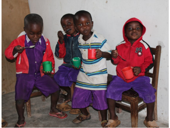
Fire børn fra Cheke Chea i Kipili

BDM har økonomisk set været igennem nogle svære år. Det har været nødvendigt at tage nok så drastiske skridt for at stabilisere økonomien, så der i større udstrækning blev sammenhæng mellem indtægter og udgifter. Det bliver vi også nødt til at have fokus på i årene, der kommer. Derfor er det helt afgørende, at antallet af de mennesker, der beder for og støtter BDM økonomisk bliver væsentligt flere. Hvordan kan det blive til virkelighed?