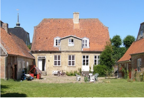
Lindegade 26 før

baderum, men skæmmede sydfacaden betragteligt. Kvisten blev nedbrudt og toilettet indpasset i tagetagens planløsning, og således har sydfacaden genvundet sit smukke udtryk.