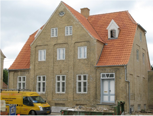
Præsteboligen Lindegade 26