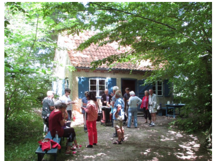
Der snakkes og spises pølser

Der blev lavet hold som blev sendt på billedstafet rundt i skoven og så var der mulighed for at eksperimentere med at lave flotte sæbebobler.