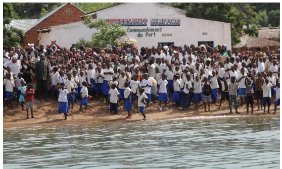
Varm modtagelse i Congo

BDM gør en stor forskel gennem det arbejde, der udføres. Missionærerne arbejder dedikeret med det, der er deres område. Nogle med sundhed, andre med byggeri, nogle med undervisning og pleje af børn, andre med evangelisati-