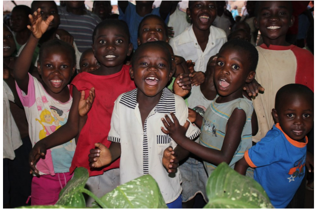
Dejlige glade børn

Jeg glæder mig meget over det store engagement, som mennesker i Brødremenigheden lægger i BDM's arbejde i byen. Det gælder