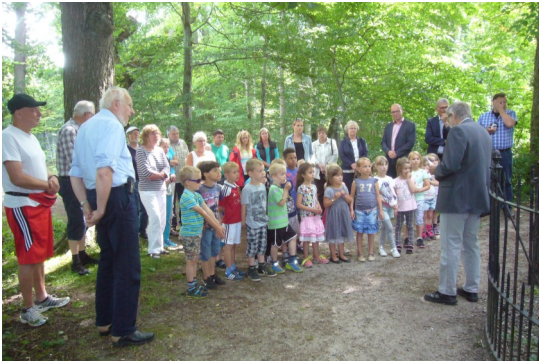
En dejlig flok lyttende elever