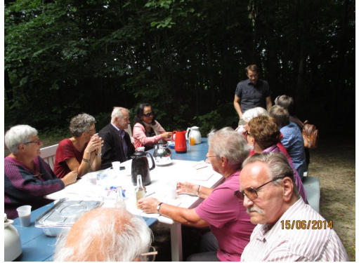
Kaffen nydes i Christinero