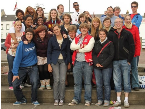
De yndige, unge deltagere

Sådan har jeg stort set altid opfattet det, når jeg har været på tur med Brødremenigheden. Dette blev igen bekræftet, da jeg fra den 10. til den 20. august var i Nordirland til Moravial. Det er en lejr for unge fra Brødremenigheden i hele Europa. Vi var ca. 25 unge mennesker fra henholdsvis England, Nordirland, Holland, Tyskland og så undertegnede til at holde den danske fane højt. Der skulle også være kommet to albanere, men de kunne ikke komme igennem grundet vi-