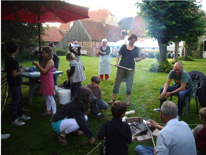
Her bages der snobrød