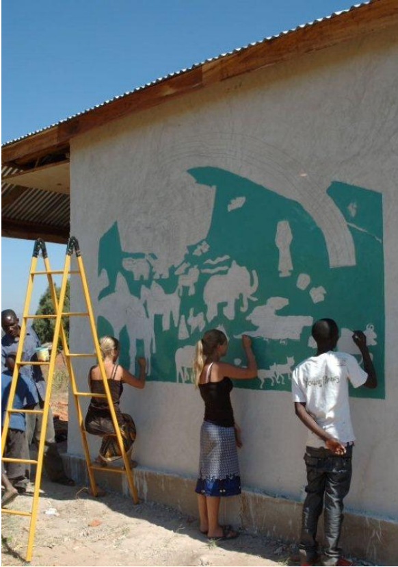
Volontørerne maler Noahs Ark

seminarer i Kipili, teamet har undervist dem under besøg i landsbyerne og nu skal de så selv tage ansvar i deres landsbyer. Mobilklinikkenes team er der som konsulenter, og der evakueret efter hver dag med lokales undervisning. Hermed opfyldes et væsentligt mål med projektet, at de lokale selv tager ansvar.