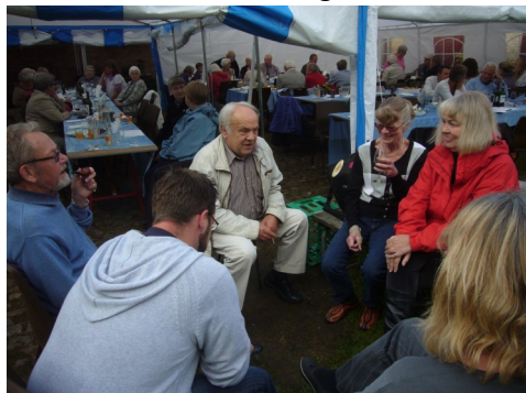
Der spises, leges og snakkes