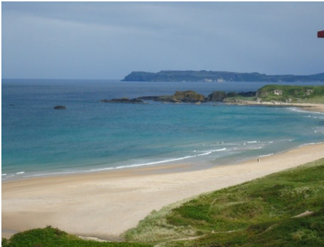
Udsigten fra White Park Bay

Derudover bød lejren også på en lang række naturoplevelser, da Nordirland er et utroligt flot og