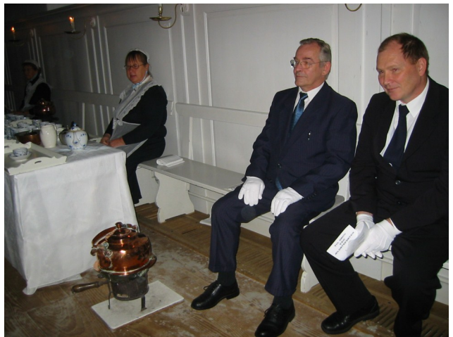
Fra kærlighedsmåltidet 13. august