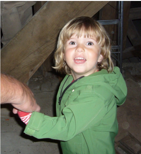
Lucca på vej op i kirketårnet