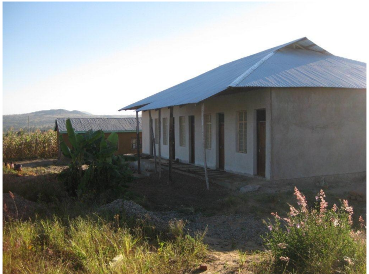
Børnehjem i Sumbawanga

Under besøget i Sumbawanga mødte jeg kirkens nye ledelse, og det blev til en god samtale om partnerskab og samarbejde i kommende år. Vi drøftede Mobilklinikens fremtid med en mulig