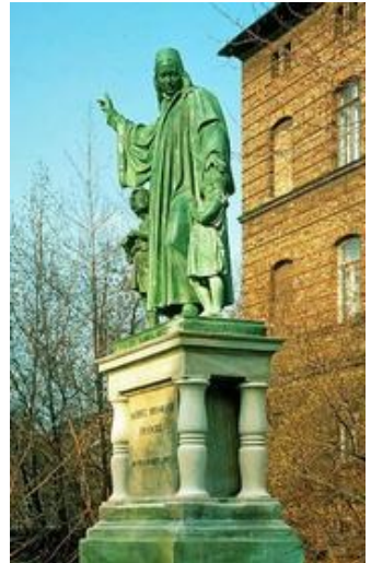
Monument af Francke rejst i 1829

Tiden i dr. Franckes skole i Halle var streng for den unge grev Zinzendorf. Lærerne var meget hårde ved ham, og selvom de aldrig kunne fange ham i at lave gale streger, så straffede de ham ofte. De troede ikke på, at han var en god knægt og satte derfor andre drenge til at udspionere ham. De store drenge mobbede ham, og behandlingen blev værre