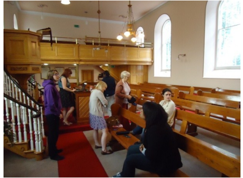
Kirken i Gracehill

at der er fem menigheder i Nordirland. De fire andre menigheder består kun af en kirkebygning.