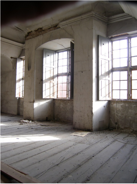
Samme sovesal mod øst