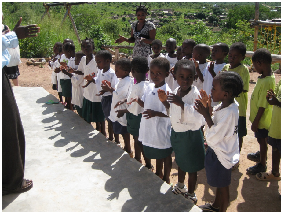
Børn i Cheke Chea i Kipili.