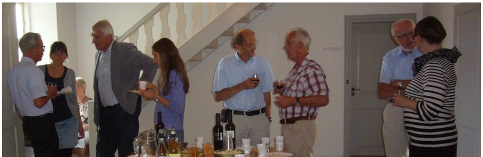
Snakken gik livligt ved receptionen