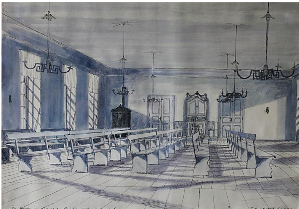
Akvarel af Lars Svane 1946 Søstrehusets korsal med kakkelovn.