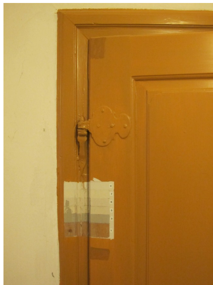
Til venstre en farveundersøgelse der viser tidernes forskellige farver, til højre farvprøve med en okkerfarvet dør.