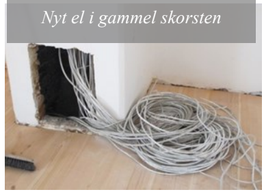
Nyt el i gammel skorsten