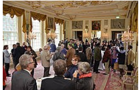
Modtagelse på slottet i Zeist

udspil til næste synode. Det viste sig, at der var langt flere faktorer på spil. Er alle dele af arbejdet i menighederne repræsenteret? Har nogle grene for stor indflydelse? Og omvendt? Er to fra hver menighed retfærdigt, når der er en menighed på 100-150 medlemmer og andre på et par tusinde? Kan arbejdsformen forenkles? Skal synoden afholdes i forbindelse med weekend, helligdage og lignende, som det er nu har mange brugt en ferieuge på det? Kan man aflaste den kæmpestore indsats, som værtsmenigheden må yde?