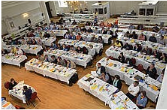
Plenum set fra oven

Lørdag den 14. juni samledes ca. 100 synodaler i Zeist i Holland. Foran lå en uges intenst arbejde som øverste myndighed i vores provins. Repræsentanter for missionerne, ungdom, præster, teologisk uddannelse, direktion og naturligvis fra menighederne. Dertil kom