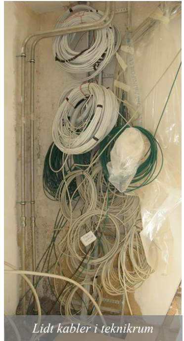
Lidt kabler i teknikrum