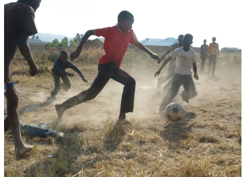
Fodbold er også her populært