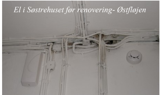
El i Søstrehuset før renovering- Østfløjen

Nu er situationen jo den, at Søstrehuset fremover skal bruges til mange mennesker og funktioner, så af denne årsag, kommer der MANGE flere moderne installationer, der skal forsøges skjult div. steder i bygningen. De mange evt. gæster