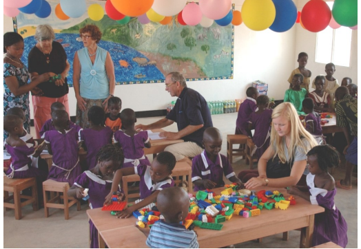
Seniorvoluntørerne i Kipili

BDM har haft 8 seniorvolontører fra Lindehøjkirken i Herlev i Kipili i Tanzania, hvor de har været med til at bygge en Cheke Chea og lavet en legeplads. De har indsamlet ca. 50.000 kr. til projektet, og for nyligt blev der afholdt et cykelsponsorløb, hvoraf de 13.000 kr. går til uddannelse af en lærer.