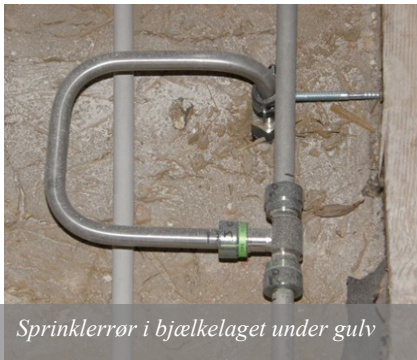
Sprinklerrør i bjælkelaget under gulv