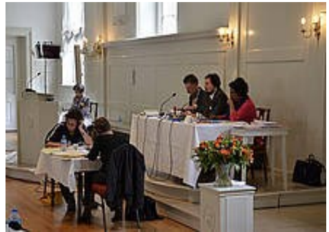
Så er arbejdet i gang Synodaledelse og- sekretærer

I nogle menigheder sidder udvalgte/indkaldte (fagkompetente) medlemmer i Ældsterådene. Disse er ikke alle medlemmer af brødremenigheden, men har en stor indflydelse i pågældende menigheders forhold. Derfor blev det