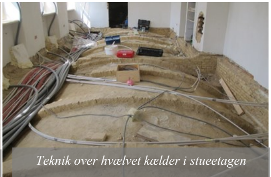
Teknik over hvælvet kælder i stueetagen