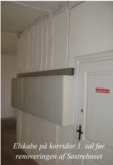
Elskabe på korrridor 1. sal før renoveringen af Søstrehuset