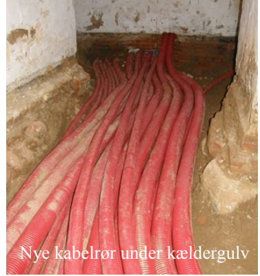
Nye kabelrør under kældergulv

El, internet, røgalarmering og nødbelysning m.m. kræver også mange installationer/kabler. For at beskrive omfanget kan nævnes at der er anvendt: 8,5 km. ”elektrikerrør” – Både stive og fleksible. Disse er samlet med 2.200 muffers. Der er brugt 2.500 metalbøjler som så er fastgjort med 5.000 skruer. Der er brugt 1,5 km. store røde kabelrør i diameter fra Ø50 til Ø110 mm. 600 meter kabelbakke i forskellige bredder, men helt op til 40 cm brede. 15 kilometer kabel, datakabel og brandhæmmende kabler.