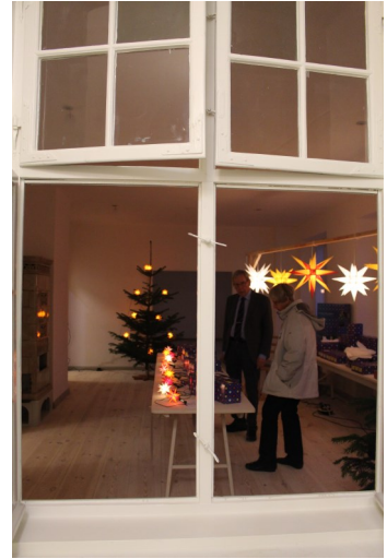
Et kig ind i den nye BDM butik

Der er flere måder at være fællesskab på. Men når det fungerer rigtigt, kan der opstå en synergi, hvilket som bekendt er et samspil mellem to eller flere faktorer, der forstærker hinanden, således at den kombinerede effekt bliver større end summen af de enkelte faktoreres bidrag. Om det vil lykkes, ja det vil vise sig. Jeg tror det vil lykkes.