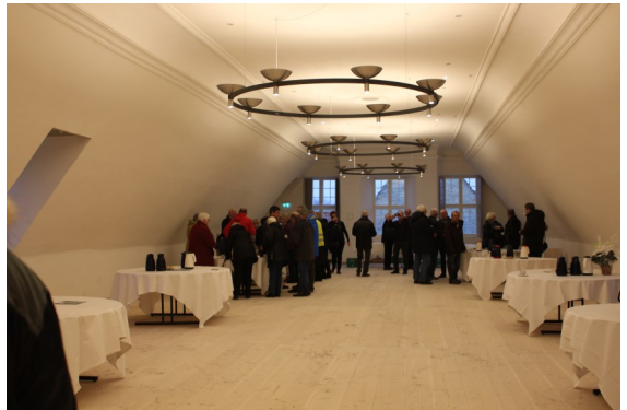
Et kig ind i Multisalen

Huset danner en ny kategori, hvor arkiver og museumsudstillinger, turistbureau og viden-center lever, ikke bare side om side, ikke bare i sammenhæng med, men i gensidig frugtbarhed med musik-udøvelse, forskere, gæster og en international horisont.