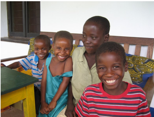
Glade børn fra børnehjemmet i Sumbawanga

venter at det bliver i begyndelsen af det nye år. Vi håber, at der er mange i Brødremenigheden, der vil følge os på hjemmesiden, hvor der vil være nyheder om arbejdet. Her vil der også ligge link til små film på YouTube, som vi har optaget i Tanzania og DR Congo.