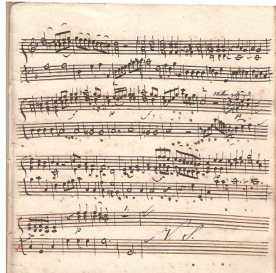
Eksempler på gamle håndskrevne noder i arkivet