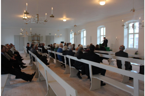
Fra den flotte korsal ved indvielsen af Søstrehuset

En tanke om at skabe et center for kulturelle aktiviteter opstod og udvikledes i løbet af 2011 og få dage før jul 2011 blev et brev overrakt fra A. P. Møller og Hustru Chastine Mc-Kinney Møllers Fond til almene For-