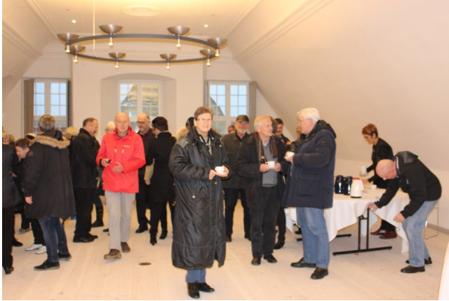
Multisalen hvor gæsterne ved Åbent Hus arrangementet fik kaffe

sammen vil udgøre husets beboere i fremtiden. Der skal ligeledes lyde en stor tak til det kommunale embedsværk, mange afdelinger har været involveret, og viljen til at finde løsninger på komplicerede problemer i forhold til at overholde love og regler har ført til restaureringens fuldendelse.