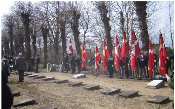
Fra kransenedlæggelsen 23. april