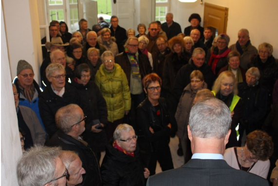
Velkomst i Søstrehuset ved Åbent Hus arrangementet

Husets placering i Sønderjylland vil betyde et åbent blik for både danske nationale værdier og internationale perspektiver og vil med kunst, videnskab og kulturarv bidrage med byggesten til en brobygning mellem det lokale og