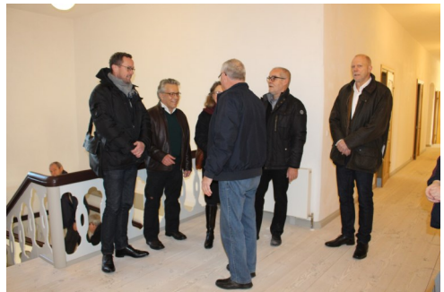
Repræsentanter for Fonden og Kulturstyrelsen

Udfordringen er at gøre kulturarven aktiv, vedkommende og spændende, ved at invitere kreative kræfter, dygtige kunstnere og videnskabsfolk sammen med mennesker, der søger informationer, indblik og inspiration til at kende både sig selv og den omgivende verden indenfor i huset. I dette krydsfelt af læg og lærd, af kunst og viden forventes det, at noget nyt vil opstå.