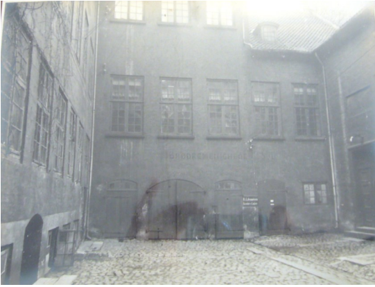
Stormgade set fra gården Man ser svagt der står Brødremenigheden på væggen