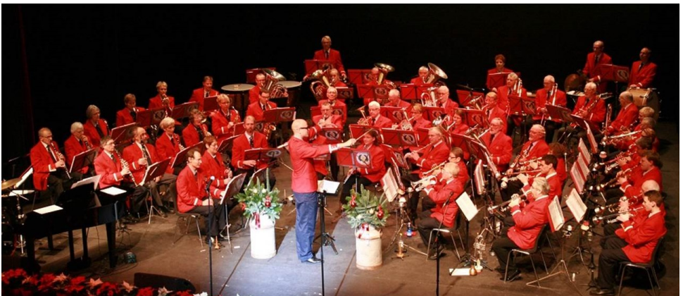
Fredericia Postorkester ved julekoncerten 2012