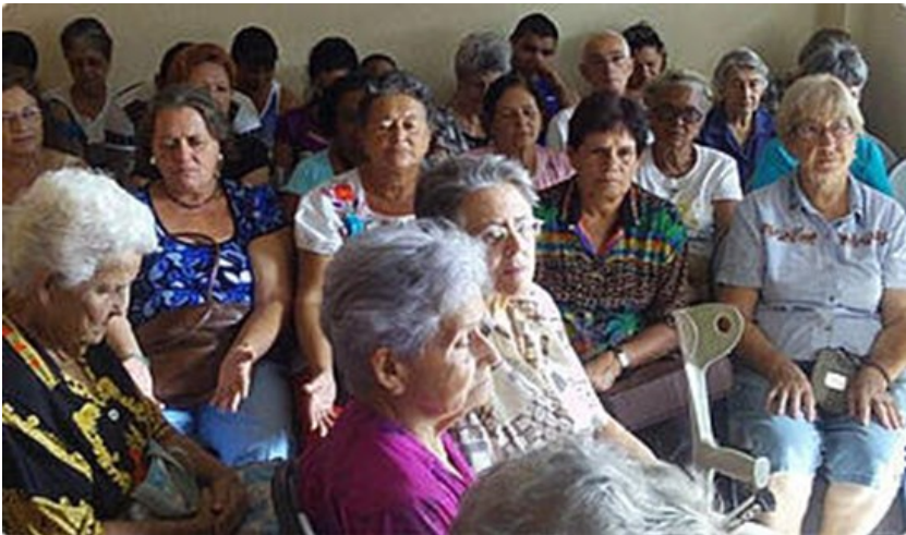
Antal deltagere i gudstjenesterne vokser

gang samledes kvinder til det første søstertræf 1. søndag i advent. 60 kvinder var tilstede og man valgte et nationalt søsterråd. Her i foråret