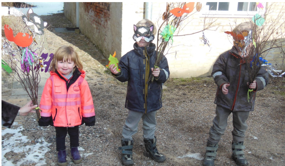
Lidt stemning fra "Sjov søndag"