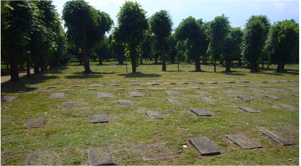
Gudsageren i Herrnhut, med Zinzendorfgravstenene på midtergangen

”Ich aber wär ein undankbar Herz, wenn ich nicht mit einem wahren Schmerz Als der teuren Gräfin ihr Ehe-Engel Manche im Dienst vorgekomne Mängel Beweinte.”