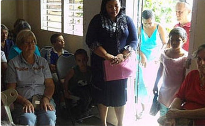
Brødremenigheden på Cuba holder gudstjeneste i private hjem

Den 11 januar blev den lille, unge Brødremenighed i Cuba statslig anerkendt. I juni 2012 søgte man om anerkendelse og skulle derpå svare på