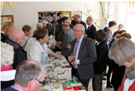
Der var trængsel i butikken hele dagen, alle ville se hvad Shop Karibu kunne byde på.

Både til selve åbningen og senere på dagen var der mange, der besøgte Shop Karibu, og omsætningen tyder på, at butikken tilbyder ting, som faldt i kundernes smag. Der blev budt på et lille glas i forbindelse med åbningen. Der var 80 glas, og de blev hurtigt brugt, og en del nåede ikke frem til bakkerne med glas. Så der var vel godt 100, der besøgte