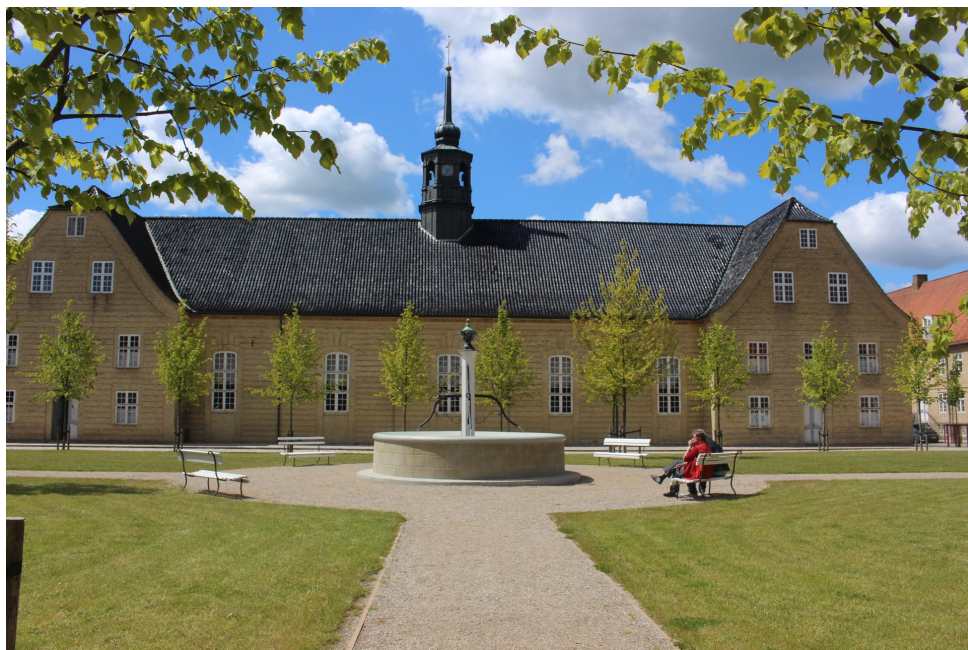
Brødremenighedens kirke set fra kirkepladsen