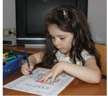
En pige fra børnehaven i Burrel