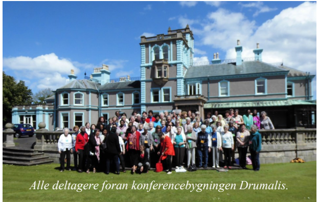
Alle deltagere foran konferencebygningen Drumalis.

Alt i alt en spændende og begivenhedsrig oplevelse.