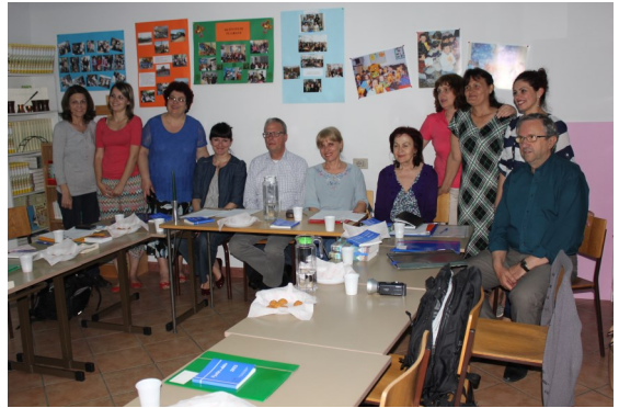
Bestyrelsen i Brødrekirken i Albanien

Det er meget opmuntrende at få lov til se, hvordan kirken på denne måde vokser. Her er voksendåb helt naturligt, fordi det er først nu, at de får mulighed for at blive døbt. I forbindelse med dåben overrækkes en bibel og et kors til minde om en stor dag i disse menneskers liv.