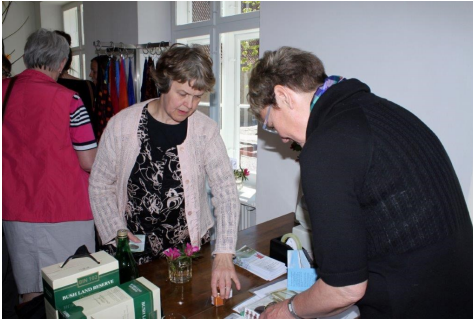
Så bliver kasseapparatet indviet

butikken efter borgmesteren havde klippet snoren.