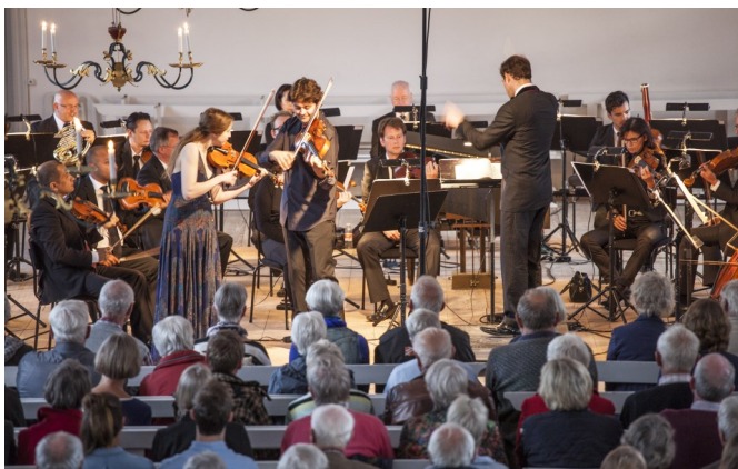
Sønderjyllands Symfoniorkester fra åbningskoncerten