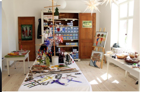
Et blik ind i den bagerste del af forretningen.