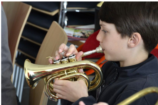
En af "Jungbläserne"

Programmet indeholder også velkomstsamling, 'singstunde', morgenmusik i gaderne, gudstjenester i Herrnhut og omkringliggende kirker, nadvergudstjeneste og naturligvis en 'Reisesegen'. Til alle disse arrangementer var de forskellige menigheders blæsere fordelt. Det giver nogle rigtig flotte gudstjenester m.v.