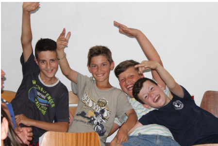
Drenge i Bathore

I BDM glæder vi os over den medleven og engagement, Brødremenigheden viser. Tak for de mange penge, I samler ind i kirken, og tak til jer, der beder for arbejdet. I BDM opfatter vi jer som en væsentlig del af vort bagland.