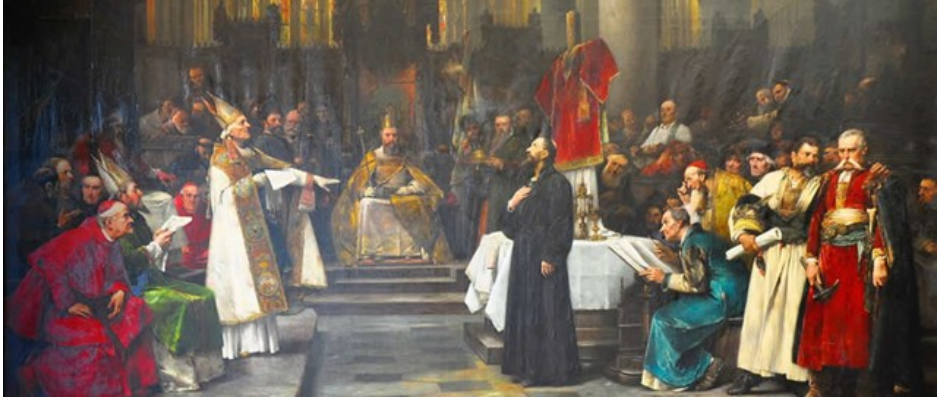
Jan Hus ved koncilet i Konstans. Maleri af Václav Brožík

Sagt af Jan Hus, da han blev brændt på bålet som kætter og så en ældre bonde lægge mere brænde på bålet.