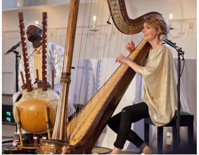
Catrin Finch og Seckou Keita

Brødremenighedens kirkesal og Søstrehusets korsal har en helt unik akustik, som tydeligt har en positiv effekt på koncertoplevelsen både for de udøvende musikere og publikum. Spilleglæden sås meget tydeligt i afslutningskoncerten med den Walisiske harpespiller, Catrin Finch, og Seckou Keita fra Senegal, der spillede på en kora. Det var ikke blot et møde mellem to verdensdele, men også et musiksk møde mellem den klassisk uddannede musiker