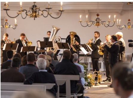
German Bras Band

og den selvlærte musiker, der ikke kan læse noder. Samspillet mellem de to bringer publikum ind i en helt ny og ukendt musikalsk verden med walisiske melodier blandet med hypnotiske improvisationer og madinkarytmer. Alle koncerter i festivalen var en utrolig stor oplevelse, men denne koncert var helt fantastisk og bliver hængende i erindringen og øret i lag tid efter festivalens afslutning. At det netop var denne koncert, der var afslutningskoncerten på festivalen var ikke tilfældig. Harpen, der er et af de ældste musikinstrumenter i verden, forbinder folk fra Europa og Afrika, ligesom Brødremenighedens arbejde i disse regioner har forbundet folk med hinanden. Tekst : Hans Erik Jensen