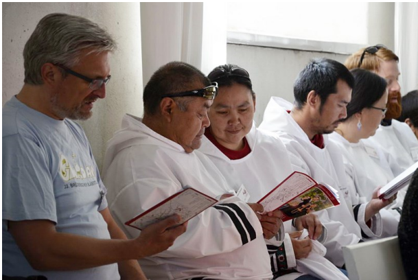
De 6 deltagere fra Labrador