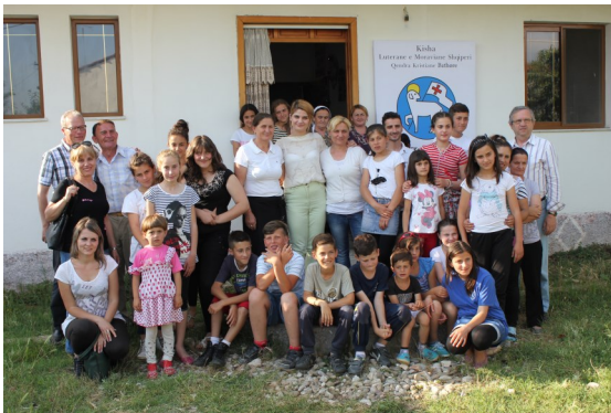
Menigheden i Bathore

I maj måned aflagde jeg besøg i Albanien, hvor jeg besøgte hovedkontoret, lejrcentret og de 5 menigheder. Det blev en stor oplevelse at møde en kirke, der næsten kan sammenlignes med de første menigheder i kirken historie, hvor man samles i hjemmene for derefter at være nødsaget til at finde større lokaler pga. pladsmangel. Menighedslivet er bygget op omkring kvinder, unge og børn. Disse grupper samles på forskellige tidspunkter i ugens løb. Kvinderne og de unge har hovedsageligt bibelstudier, mens der er forskellige aktiviteter for børnene.