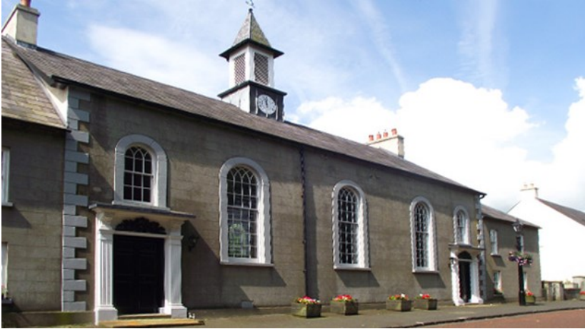
Gracehill Moravian Church. Hvor vi var til Gudstjeneste om søndagen.

Den 4-8. juni 2015 var jeg med til den 11. Europæiske Brødremenigheds Kvindekongres i Nord Irland. Vi var 75 kvinder samlet fra de Europæiske Brødremenigheder.